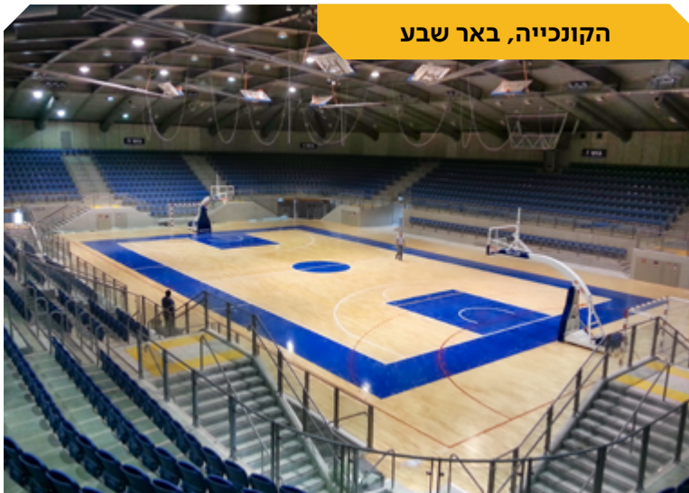
הקונכיה, באר שבע