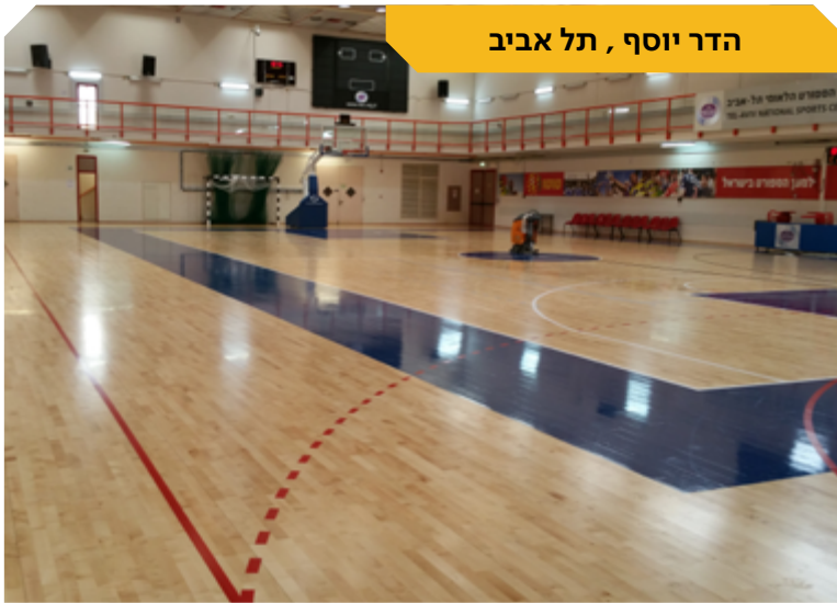
הדר יוסף, תל אביב