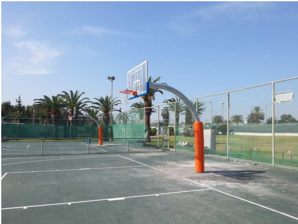
מתקן בסקט 2012